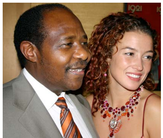
Paul Rusesabagina (gespeeld door Don Cheadle in de film) en Katja Schuurman