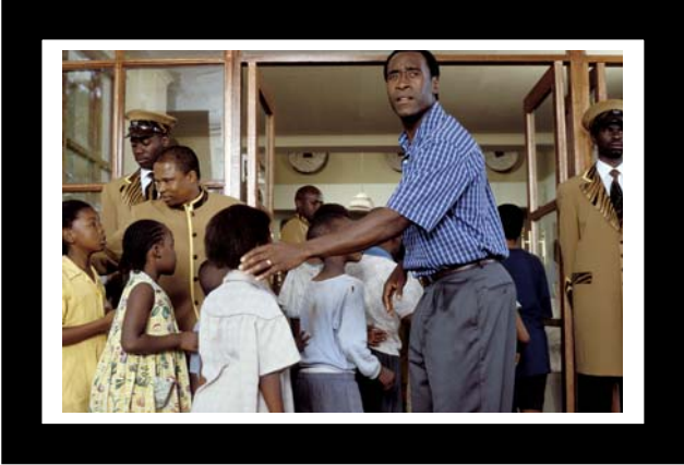
Don Cheadle begeleidt kinderen naar binnen