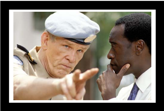
Nick Nolte en Don Cheadle