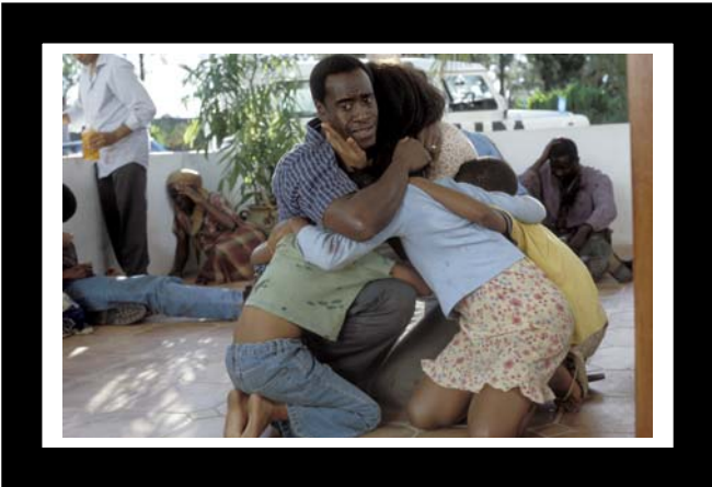
Don Cheadle in omhelzing