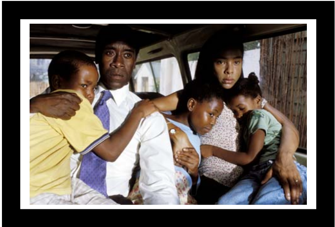
Don Cheadle Sophie Okonedo met kids in busje