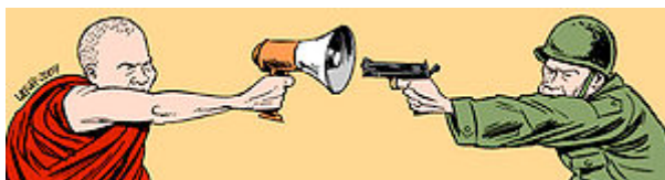
Protesten tegen de regering. "Free Myanmar". Cartoon die solidariteit met de demonstranten betuigt.

Eind september 2007 ontstond wederom een grote protestbeweging. Een groot aantal boeddhistische monniken en burgers gingen de straat op om te demonstreren voor verbetering van de levensomstandigheden van de inwoners van Birma. Dit plaatste de regering voor een groot dilemma. De monniken hadden een hoge status en groot gezag. Zonder ingrijpen zou hun actie tot grote, wellicht onbeheersbare onlusten in het gehele land kunnen leiden. Het – gewelddadig – neerslaan van de beweging zou echter tot hetzelfde kunnen leiden. Op 26 september 2007 greep het leger toch in. Monniken en burgers werden gearresteerd, gemarteld en gedood. De bevolking werd onderdrukt met nieuwe maatregelen.