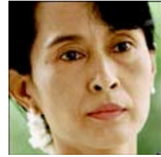
Aung San Suu Kyi

..... Birma wordt door internationale mensenrechtenorganisaties beschouwd als een extreme militaire dictatuur. De mensenrechtensituatie is er dramatisch. Er is sprake van marteling, onderdrukking van vrijheid van meningsuiting en massale dwangarbeid. Er vinden stelselmatig misstanden plaats door het leger ten opzichte van etnische minderheden.